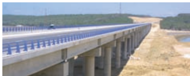
Facilité euro-méditerranéenne d'investissement et de partenariat